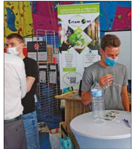
Parmi les nouvelles associations, Triamont qui œuvre pour la promotion des gestes environnementaux.

Retrouvez l'ensemble des associations leersoises sur le site de la Ville