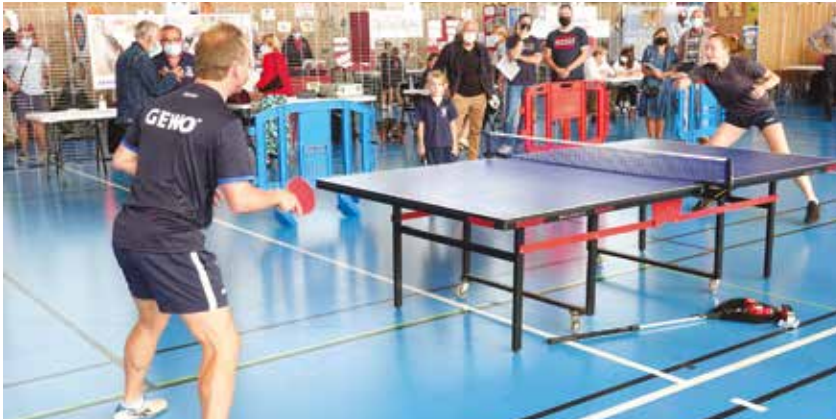
Démonstrations du LOS Tennis de table...

Le tennis de table, la danse, la gymnastique, le chant choral ou encore le karaté, sont intervenus pour faire apprécier leur discipline aux visiteurs.