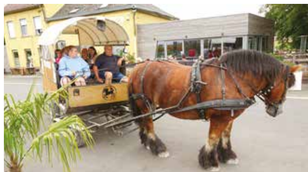
Balade en roulotte depuis le Grimonpont jusqu'à l'Aubette du canal.