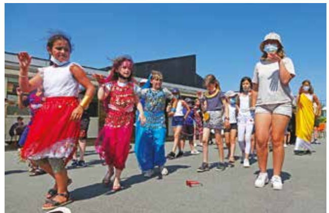
À la kermesse des Renards, chaque groupe présentait un mini-spectacle.