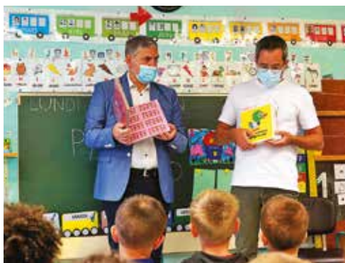
Distribution des livres à l'école Pauline Kergomard.

En fin d'année scolaire, en plus du livre de prix remis par la municipalité à chaque élève de primaire, 143 calculatrices ont été distribuées aux élèves de CM2 des écoles publiques et privées.