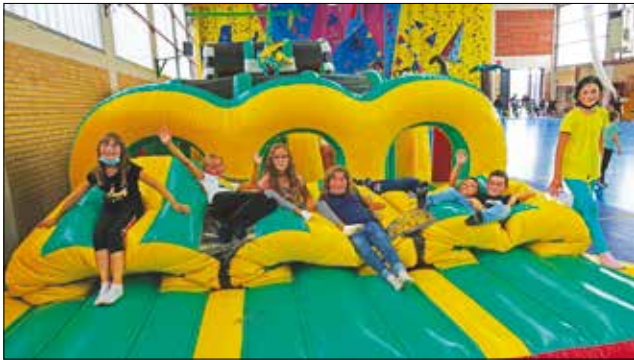
Grands jeux gonflables à la salle Alphonse Daudet.

Les animateurs et directeurs ont su faire preuve d'une grande solidarité. Quand l'ensemble de l'équipe devant encadrer les Lions en juillet s'est retrouvé en isolement, des encadrants des autres centres se sont mobilisés pour pouvoir faire fonctionner le centre des ados.