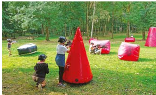
Animation laser-game au parc de la Butte.