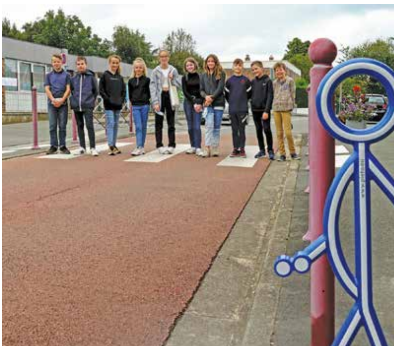
Des piéto* ont été installés aux abords des écoles pour renforcer la sécurité des élèves (projet du Conseil municipal des jeunes).