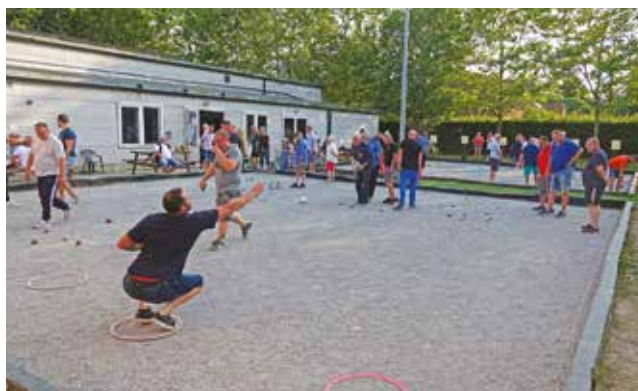
Le concours de pétanque à la vaclusienne.