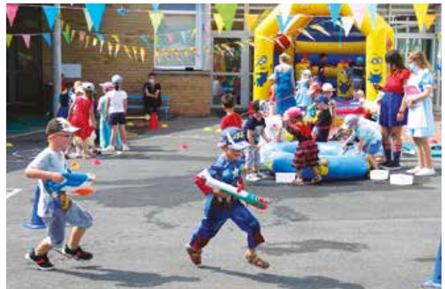
La kermesse du centre des Poussins.