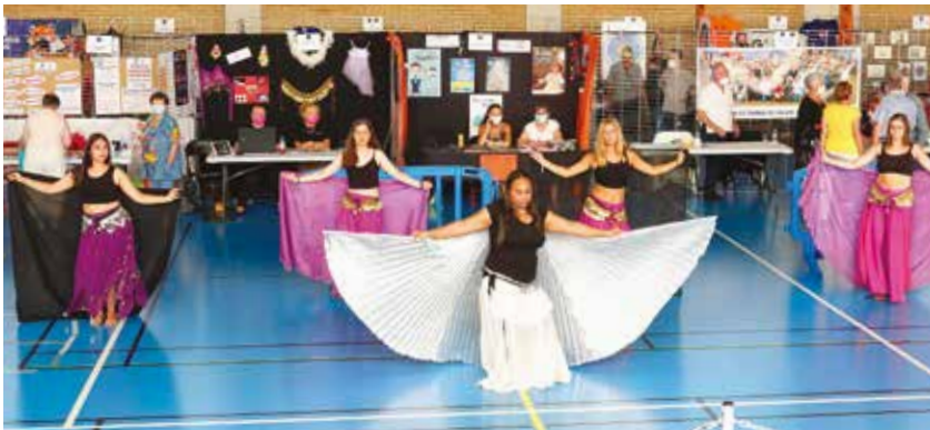
... de la section Danse orientale d'Artanime