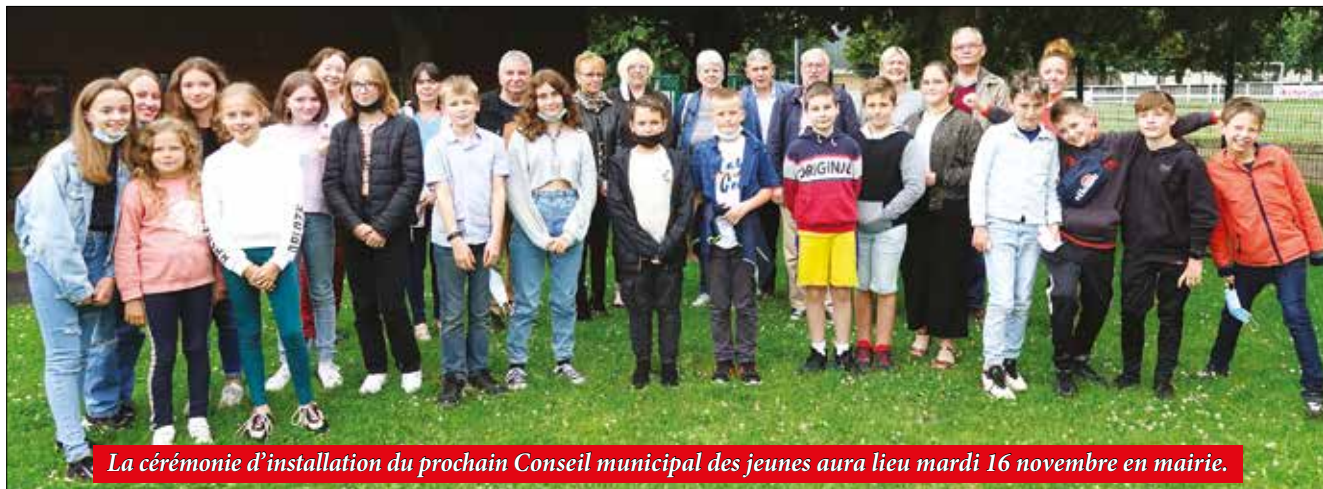
La cérémonie d'installation du prochain Conseil municipal des jeunes aura lieu mardi 16 novembre en mairie.

Le prochain Conseil municipal des jeunes sera élu le 22 octobre. Les élèves de CM1-CM2 des trois groupes scolaires de la commune peuvent se présenter aux élections.