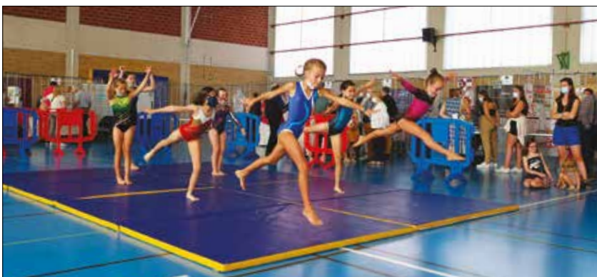
ou du LOS Gymnastique.