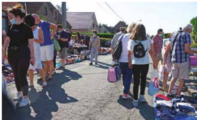
Retour (presque) à la normale pour les puces du Jumelage.