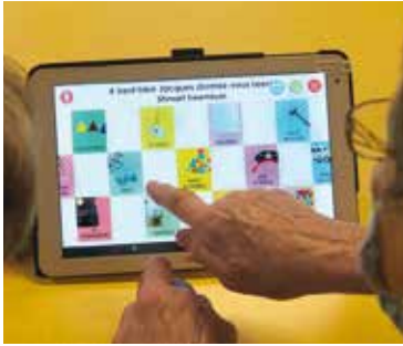
De nombreux jeux installés sur les tablettes.

La prise en charge peut être individuelle ou collective lors d'ateliers, comme par exemple les actions mises en place pour les résidents des Quatre Vents.