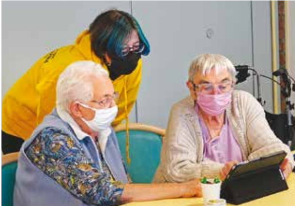
En binôme, on progresse plus vite!