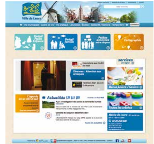
... et Version 2011.