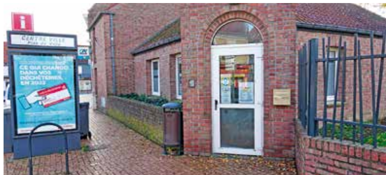
L'espace de travail partagé se situe place Lucien Demonchaux.

La première accueillera trois bureaux en îlot central, la deuxième quatre bureaux et un espace commun à l'étage. Les locaux vont être remis à neuf par les services municipaux et équipés de matériel informatique et de bureau. La charte d'utilisation est en cours d'élaboration.