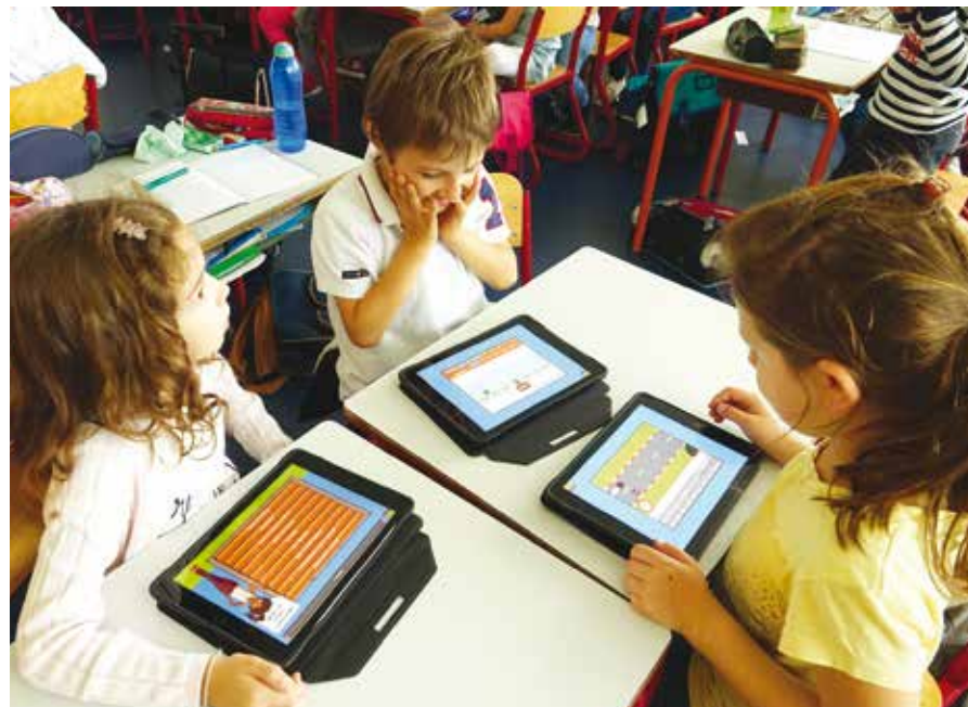
Des applications numériques adaptées au programme scolaire.