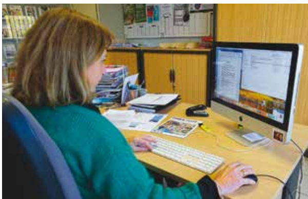
Rédaction de l'information.