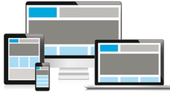
Le nouveau site Internet de la Ville - À découvrir dès janvier 2022... sur ordinateurs, téléphones et tablettes.