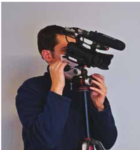
Vidéos pour le site Internet et les réseaux sociaux de la Ville.

En 2014, la Ville s'est dotée d'un panneau électronique d'informations et s'est équipée de caméras vidéo , permettant la réalisation de films et la retransmission d'événements.