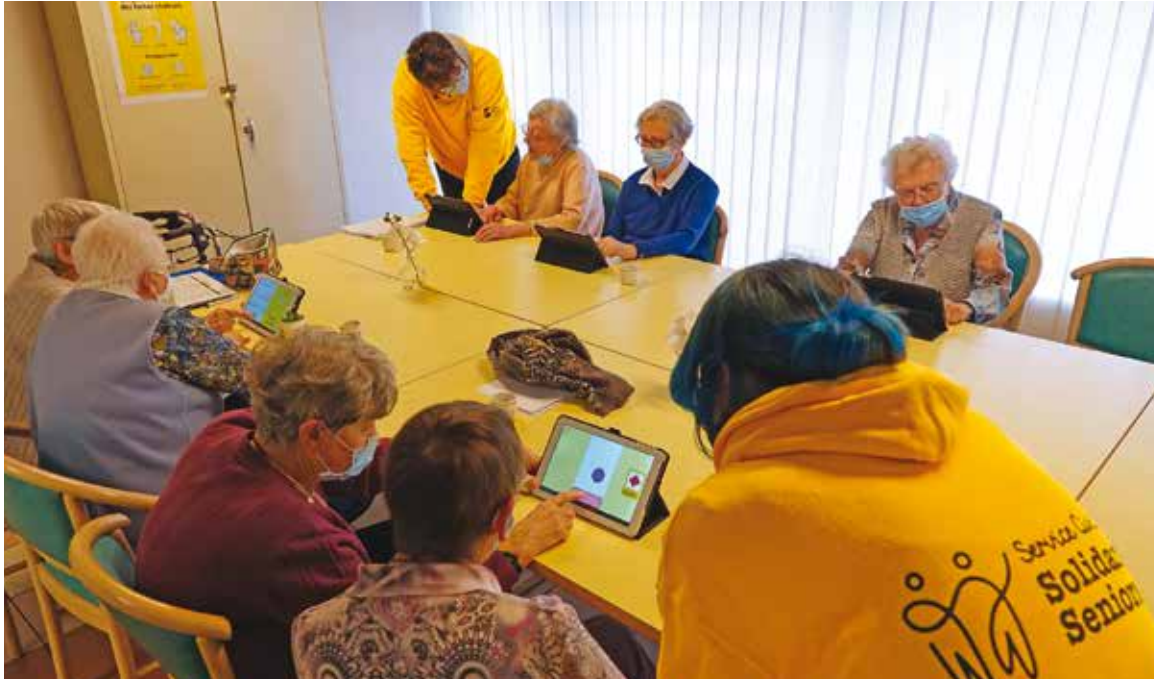
Deux engagés du service civique initient les résidents des Quatre vents au numérique grâce à des applications ludiques.