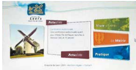
Le site Internet de la Ville : Version 2004...