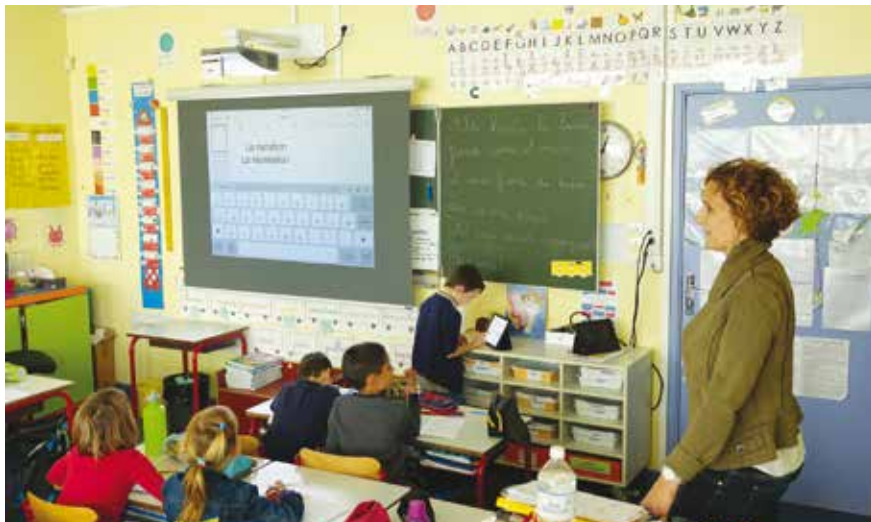
Exemple d'utilisation des tablettes et vidéo-projecteur en classe de CP à l'école Léonard de Vinci.

Dès 2017, la Ville s'est engagée pour la généralisation du numérique à l'école dans la cadre du plan lancé par l'Éducation Nationale. Elle a équipé progressivement les classes élémentaires des écoles publiques en matériel numérique. En 2017, les classes de maternelles ont reçu 30 tablettes et des appareils de vidéo projection. De 2018 à 2021, ce sont les classes élémentaires qui ont bénéficié par niveau du même matériel. 60 000 € ont été investis sur 5 ans.