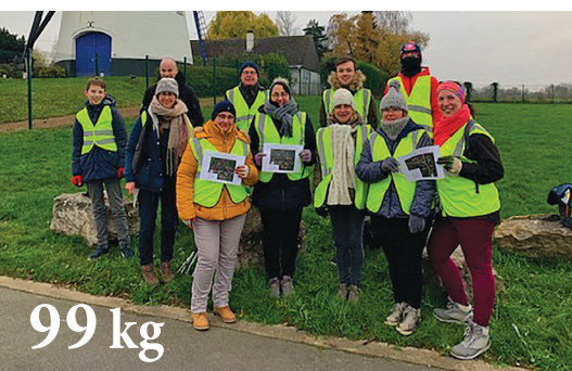
99 kg de déchets collectés lors du ramassage citoyen du 3 décembre.

À l'occasion du World Cleanup Day, le 17 septembre, le LOSBB a organisé son propre ramassage citoyen ! Une petite vingtaine de participants a collecté 53 kg de déchets en 2 heures (dont près de 2000 mégots !) Bravo à eux pour leur engagement citoyen !