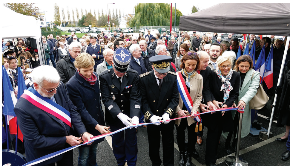
Inauguration de l'espace associatif Arnaud Beltrame page 6