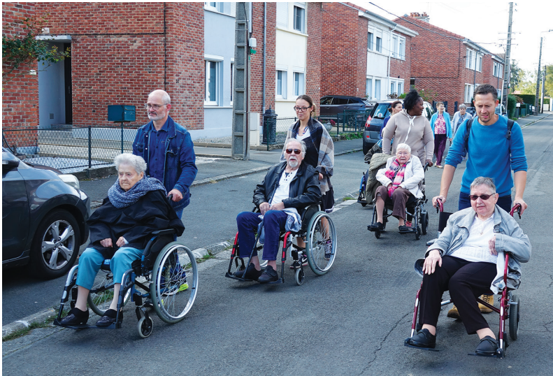
Marche bleue dans la ville à la recherche d'indices pour résoudre l'énigme : Qui est né en 1959 dans le quartier de la Mottelette, mesure 4 mètres et pèse 150 kilos? Notre géant Don Carlos Charles Philippe de la Mottelette, bien sûr!