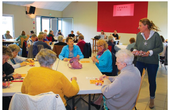
« Loto bleu » à la salle municipale du centre, en partenariat avec le SIDPA.