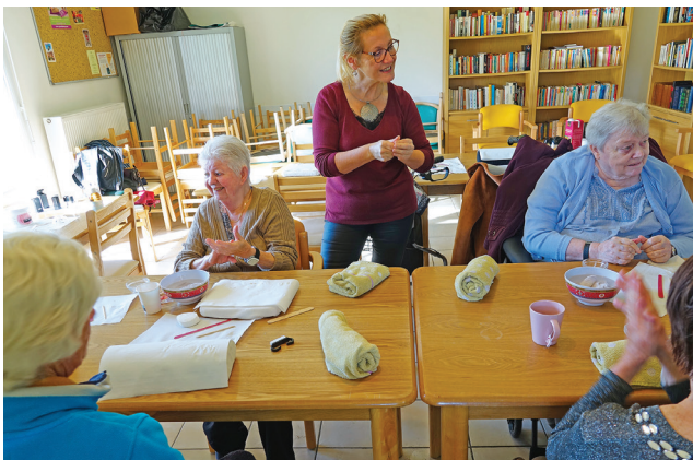
Atelier Soins des mains à la salle Jacques Lameyse, animé par une esthéticienne.