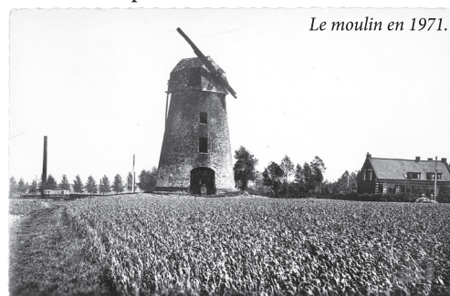
Le moulin en 1971.

Mais en 1986, un événement imprévu survient en pleine fêtes avec la rupture de l'arbre-moteur qui semblait intact mais était pourri de l'intérieur. Grâce à des subventions et avec le concours de l'ARAM, la Ville a une nouvelle fois décidé de rénover le moulin et mis l'occasion à profit pour enrayer un problème de mэрule. En 1992, l'intérieur est entièrement remis à neuf et la couverture en bardeaux de châtaignier refaite. En mars 2009, les meules de pierre sont remises en état, les montants des ailes réparés et les toiles remplacées. Le moulin est de nouveau opérationnel et permet alors de fabriquer de la farine, farine qui a servi à la réalisation de La Leersoise , bière ambrée qui a vu le jour aux fêtes du Moulin 2009. Elle a été élaborée et brassée par La Brasserie du pays flamand à Blaringhem.