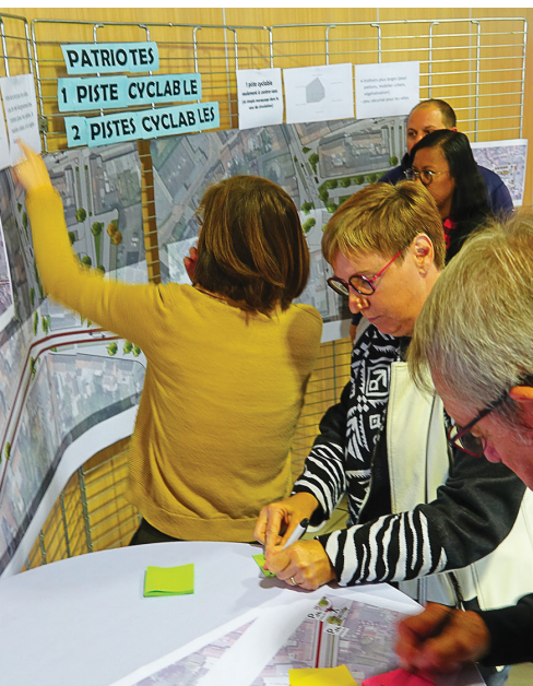
Au terme des 3 concertations, 4 scénarios sont ressortis pour le réaménagement du centre-ville. La dernière réunion a été l'occasion de les étudier et d'émettre les derniers avis.

Samedi 22 octobre avait lieu la dernière réunion de concertation sur le centre-ville. L'occasion pour les participants de découvrir les plans imaginés par la Métropole Européenne de Lille (MEL) afin de répondre aux demandes formulées par les Leersois et Leersaises tout au long de la concertation.