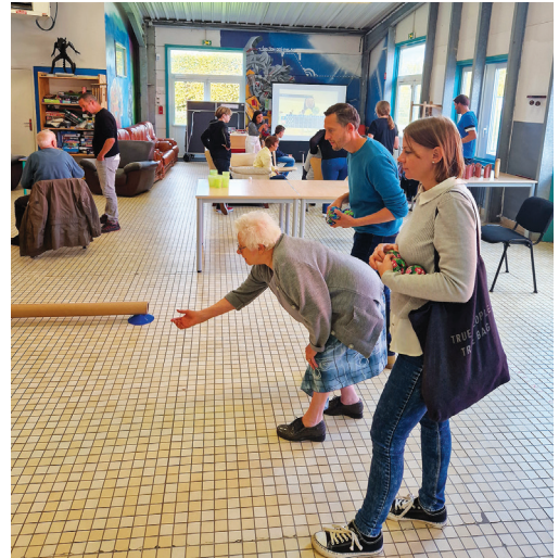
Jeux d'adresse avec les ados de la Maison des jeunes.

À cette occasion, du 3 au 9 octobre, un programme d'animations gratuites mis en place par le CCAS et dédié aux seniors a permis à nos aînés de profiter de temps d'échanges conviviaux et de rencontres intergénérationnelles. Retour en images.