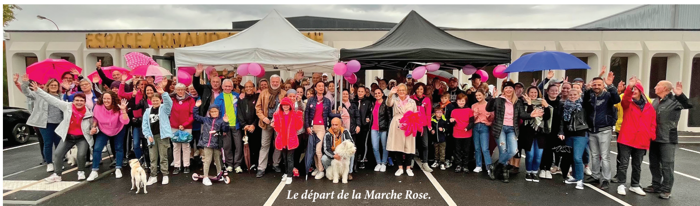
Le départ de la Marche Rose.