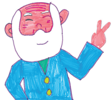
Les jeunes élus du Conseil Municipal des Jeunes ont participé à diverses animations de la Semaine bleue comme La dictée des anciens, l'atelier Cuisine mais a aussi réalisé et exposé des dessins (comme celui-ci) pour rendre hommage à leurs aînés.