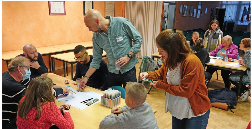
Les Leersois participants au groupe de travail ont découvert et participé à toutes les étapes de création du futur logo de Leers. Il ne reste plus qu'à l'agence Konfiture de s'inspirer de leur travail pour finaliser le logo.

Parmi les résultats de cette enquête, l'attachement au moulin est ressorti comme un élément prépondérant. Les Leersois et Leersaises sont également sensibles au cadre naturel, et à la vie animée du centre-ville. Ils présentent Leers comme une commune où il fait bon vivre, entre ville et campagne. Les caractéristiques mises en avant sont à la fois l'aspect calme et tranquille de la ville, mais aussi son dynamisme, la dimension de vivre ensemble, autour des valeurs de convi-