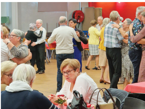
Thé dansant à la salle des fêtes, animé par l'association Nos Jeunes Années.