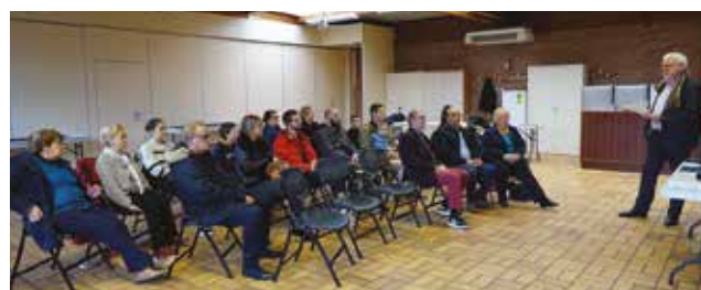
Le nouveau logo a été dévoilé au groupe de travail le samedi 7 janvier à la salle Pasteur.

Pas de gaspillage, pas de coût caché. Afin de limiter au maximum les coûts induits, les supports papiers (papier à en-tête, enveloppes...) présentant l'ancien logo seront utilisés jusqu'à épuisement des stocks. Sur les bâtiments, les véhicules et équipements divers, le remplacement interviendra progressivement au moyen d'autocollants, une solution plus économique pour un coût de 700 €.