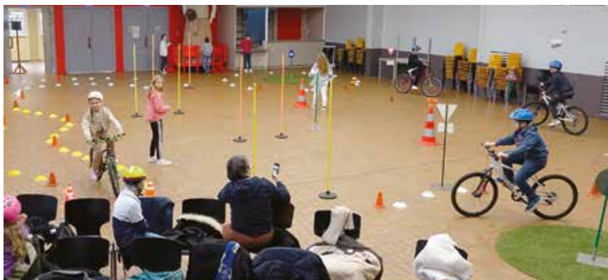
Armés de leur casque et leur vélo, les élèves ont testé leurs réflexes sur le circuit installé à la salle André Kerkhove.

Les 151 élèves de CM2 ont mis en pratique les connaissances acquises sur un circuit aménagé.