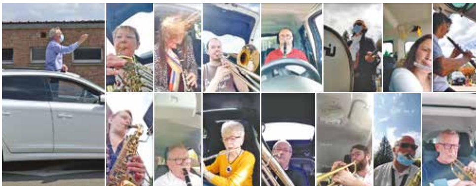
Le "Projet fou" de l'Harmonie municipale en 2021.

répondre favorablement à chaque demande de la Ville : les festivités (Fête de la Musique, Fêtes du Moulin, Allumoirs...), les cérémonies (jubilaires, vœux du Maire...) et les commémorations (Armistices du 8 Mai et du 11 Novembre). Elle réalise aussi ses propres projets. On peut citer entre autre "La Baraque à musique", "L'orchestre bavarois" (dirigé par Paul Bourgois), mais aussi plus récemment le "Projet fou" en 2021 de jouer ensemble sur un parking, chacun dans sa voiture, dans le respect des règles sanitaires induites par le Covid.