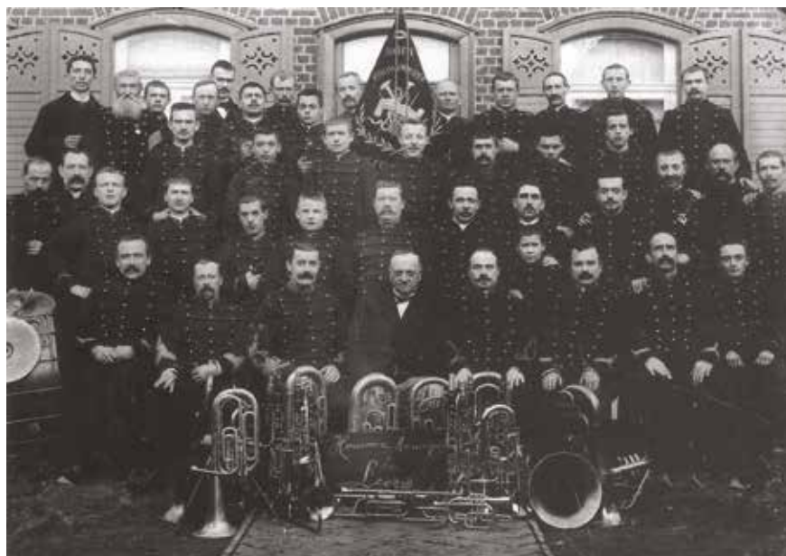
L'Harmonie municipale de Leers en 1898, avec leur premier costume acquis en 1892.

Encore aujourd'hui, malgré la disparition de nombreuses harmonies municipales, celle de Leers est toujours là, et bien là ! Très active, elle met un point d'honneur à