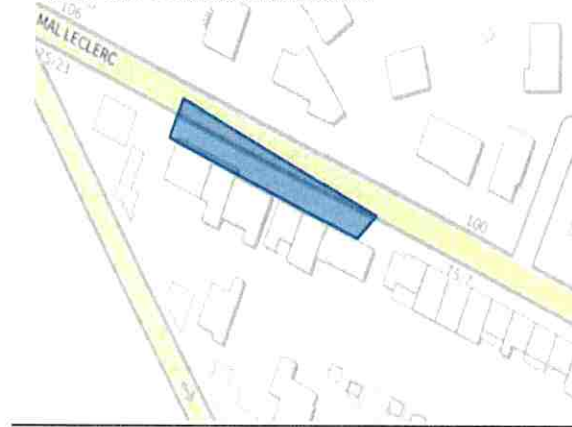
75/15 rue du Maréchal Leclerc