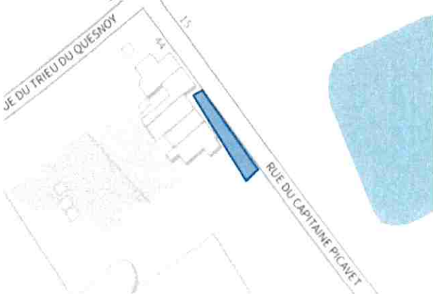
52 rue du Capitaine Picavet